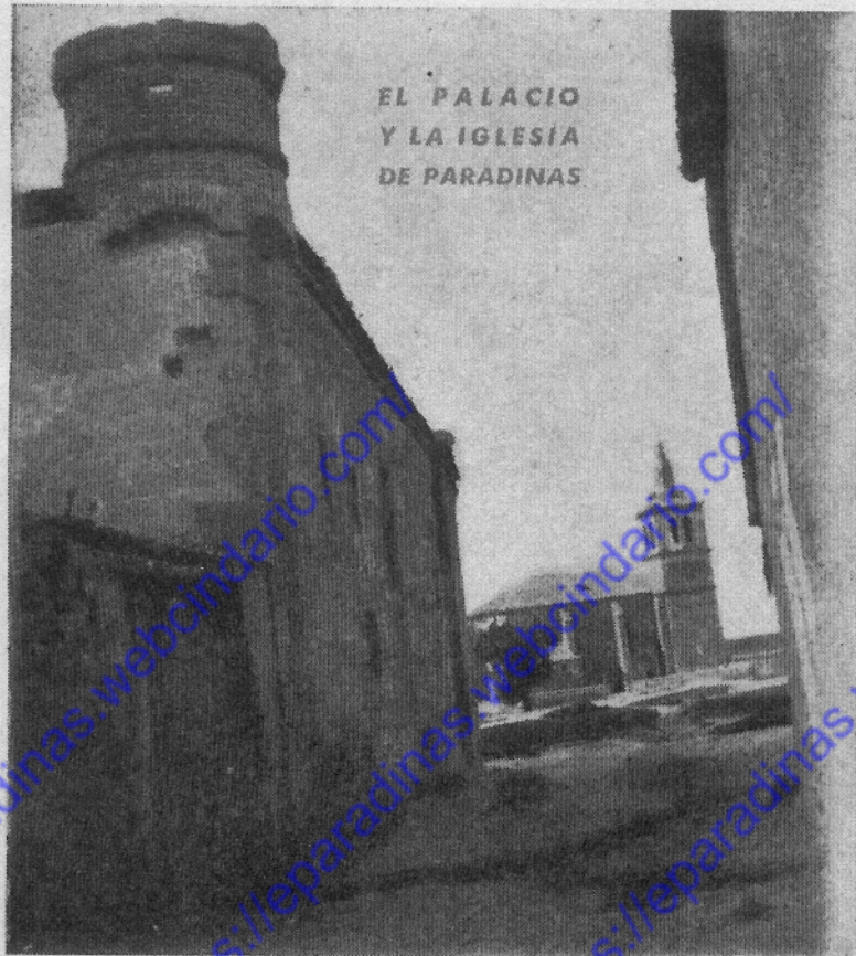
EL PALACIO Y LA IGLESIA DE PARADINAS

El noble y leal pueblo de Paradinas rinde fervoroso homenaje de vene- ración, gratitud y afecto a las